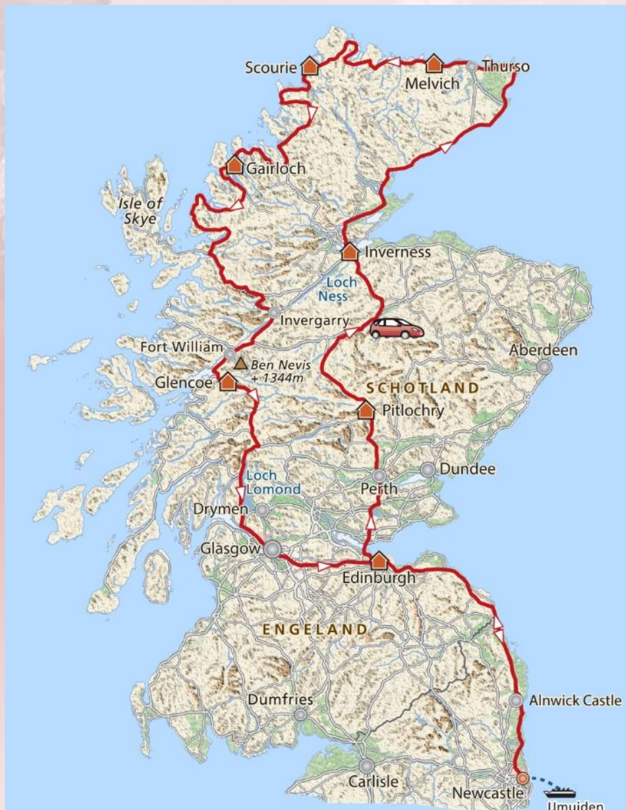
Een mogelijke route van de NC 500 vanaf de boot IJmuiden-Newcastle

Hoe lang je over die route doet hangt natuurlijk van je eigen wensen af. Als je ook tussendoor wilt stoppen om lopend wat te bekijken dan zegt men dat 5 dagen is aan te raden, je rijdt dan dagelijks zo'n 4 a 5 uren. Maar dat is dan vanuit Inverness terwijl voor ons de boot in Newcastle aankomt en vertrekt, er komt dan nog zo'n 2x 340 km bij, zie op het volgende kaartje.