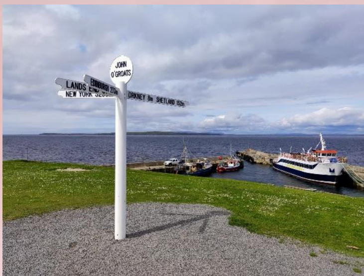
Duncansby head bij John O'Groats, in de verte op 16 km afstand de Orkney eilanden

Vanuit Inverness rijdt je langs de kust over de NC500 richting het noorden. De lange route maakt hierbij een extra lus door de echt woeste natuur van de Schotse Hooglanden langs Loch Shin (een Loch is een meer) en komt halverwege de oostelijke kustroute weer op de NC500. Je bereikt een noordelijke punt van Schotland, Dunnet Head, met de bekende vuurtoren (Lighthouse) en je gaat naar het bekende plaatsje John O'Groats met Duncansby head als verste oostelijke punt. Wat betreft het landschap is deze noordoosthoek van Schotland niet zo interessant, maar de kust met de hoge rotsen en de uitzichten is dat wel.