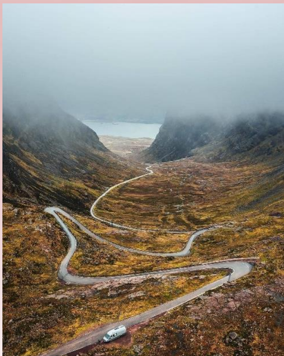
De aanrijroute vanaf Applecross naar de pas.

Vervolgens gaat de NC500 over de Applecross pass (Bealach na Ba), een prachtig maar niet gemakkelijk te rijden pasje via een klein steil weggetje, met bovenop een parkeerplaats met een fantastische uitzicht over de zee in de richting van het eiland Skye. In buien kan het hier flink tekeer gaan met enorme rukwinden.